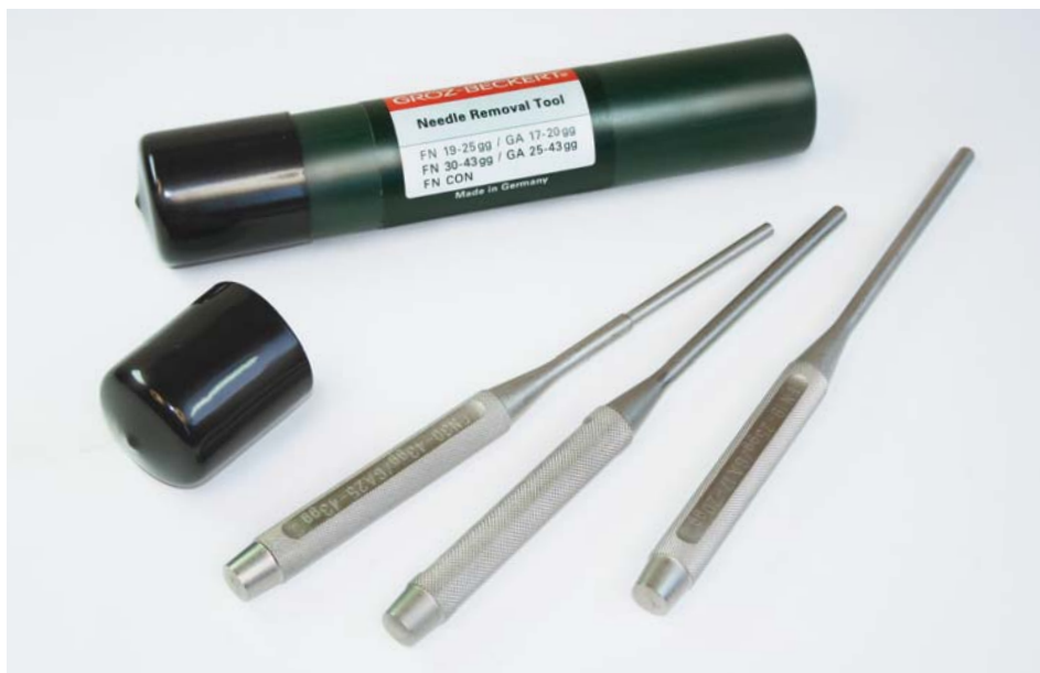
GROZ-BECKERT AUSSCHLAGWERKZEUGE – HANDLICH VERPACKT

Die spezielle Geometrie des FN CON Ausschlagwerkzeuges verhindert das Verklemmen konischer Nadeln im Schaft des Werkzeuges und gewährleistet somit einen reibungsfreien Arbeitsablauf beim Ausschlagen konischer Filznadeln aus dem Nadelbrett.